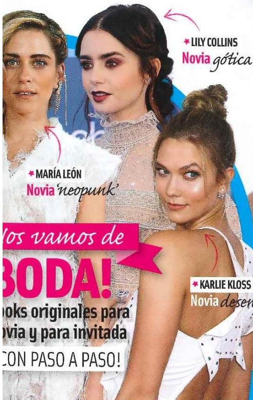
* LILY COLLINS Novia gótica

* KATY PERRY EL DANDI MÁS CAÑERO ESTÁ DE MODA