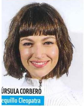
ÚRSULA CORBERO Equillo Cleopatra

* KATY PERRY EL DANDI MÁS CAÑERO ESTÁ DE MODA