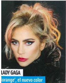
LADY GAGA 'orange', el nuevo color