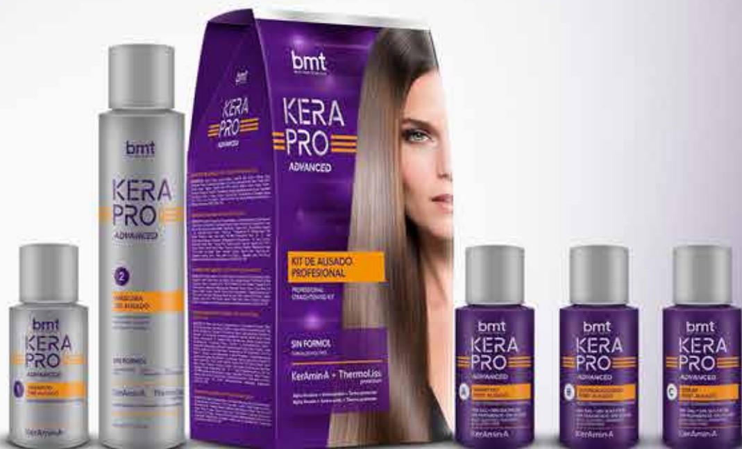
Shampoo Pre Alisado 30 mL