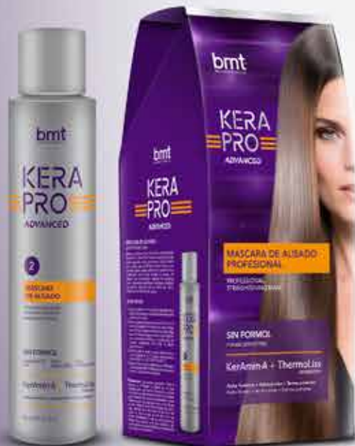
Máscara de Alisado 75 mL